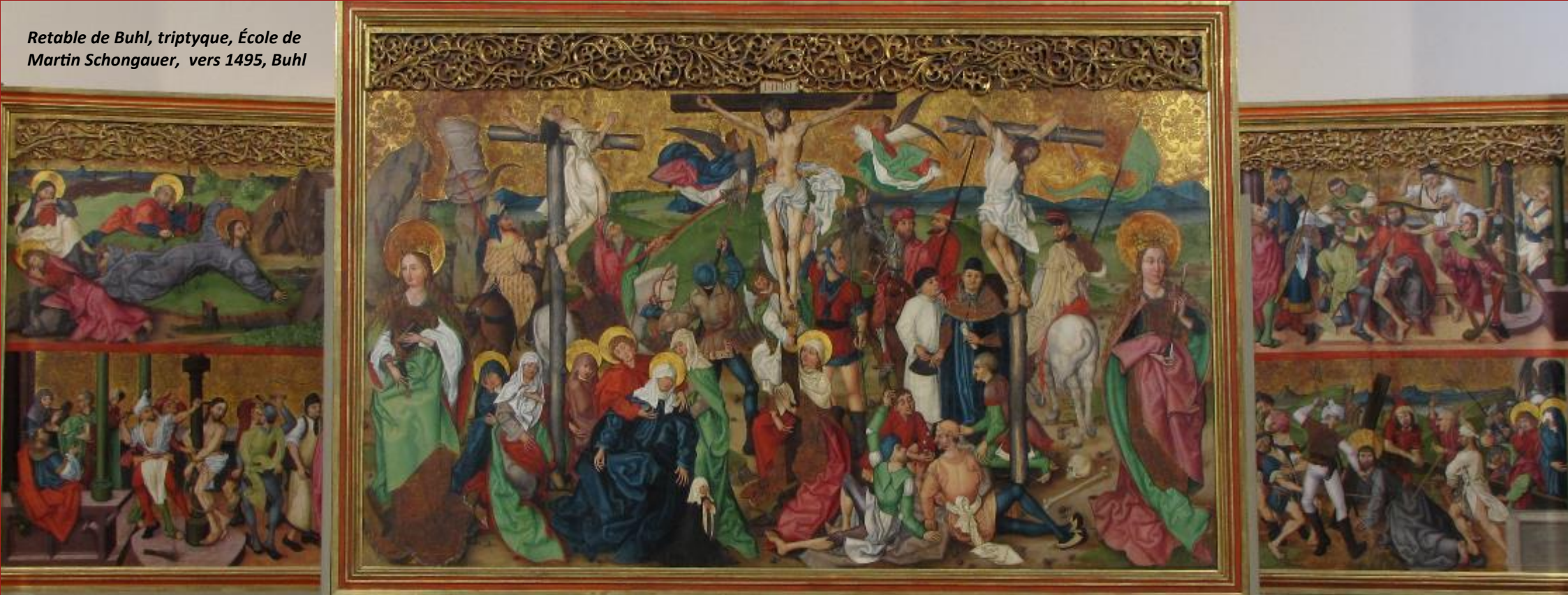
Retable de Buhl, triptyque, École de Martin Schongauer, vers 1495, Buhl