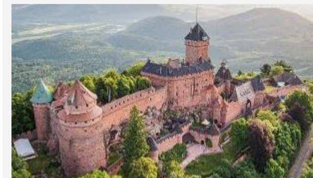
Château du Haut-Koenigsbourg