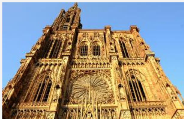
Cathédrale Notre-Dame, XI° - XIII° s., Strasbourg