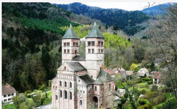
Abbatiale Saint-Léger, abbaye bénédictine de Murbach, XII° s., Murbach