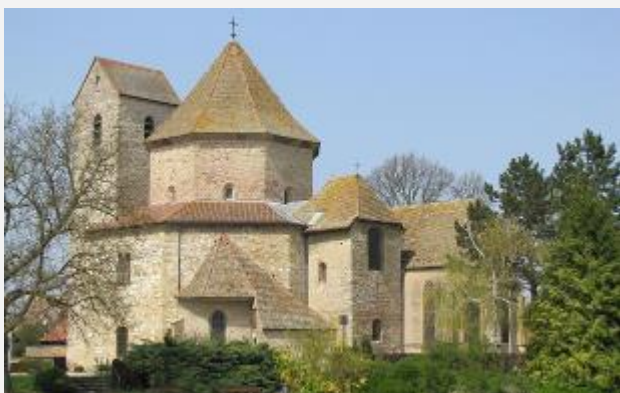
Abbatiale Saint-Pierre et Saint-Paul, XI° s., Ottmarsheim